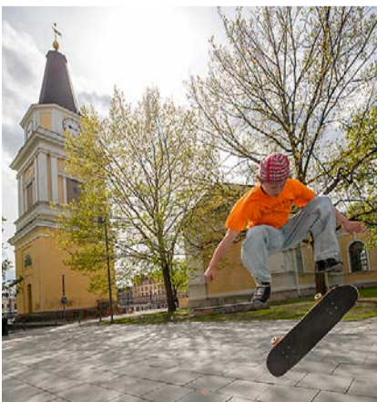
Skeittitapulitoiminnassa on mukana useita toimijoita ja järjestöjä myös ensi kesänä.