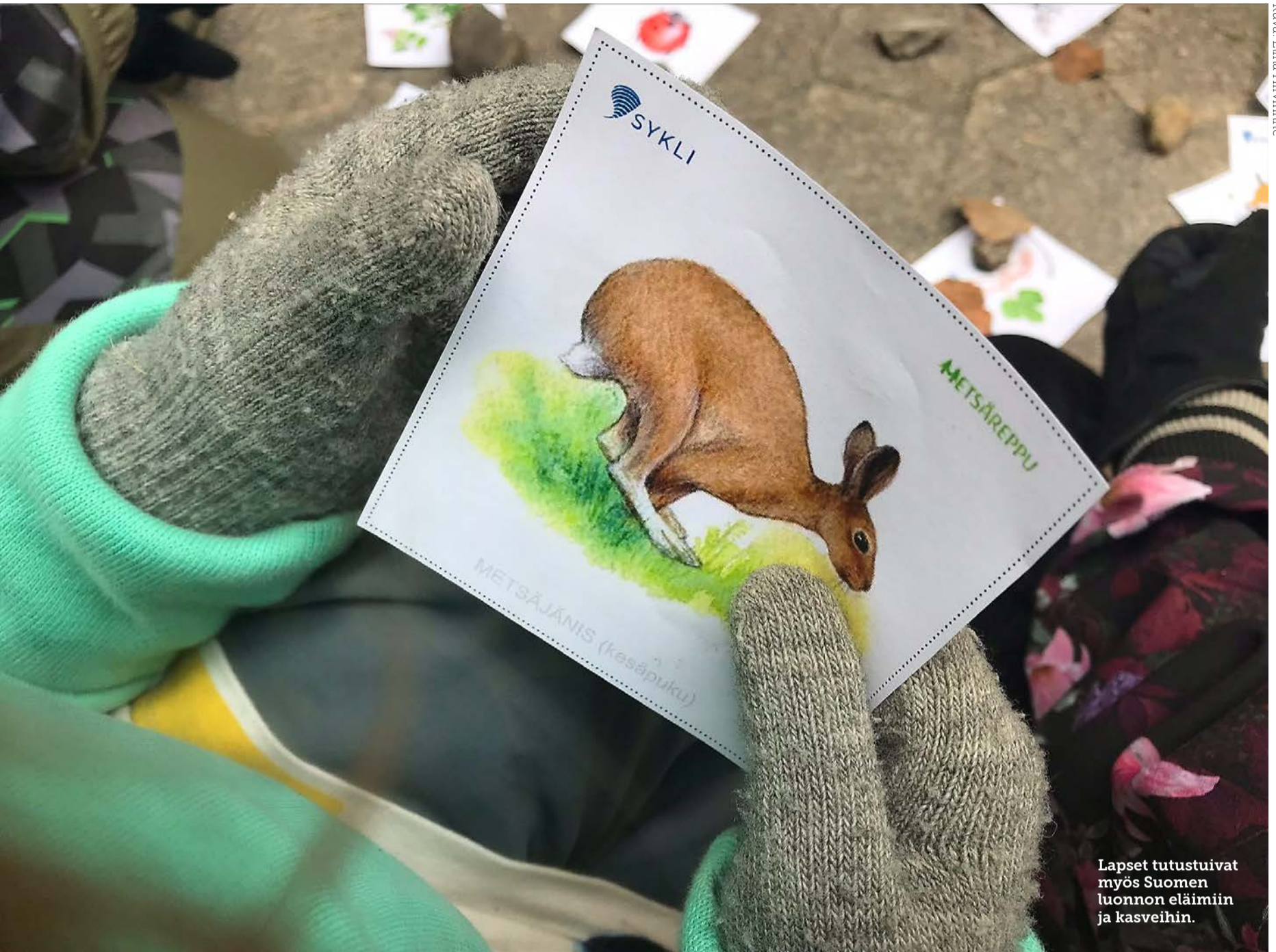
Lapset tutustuivat myös Suomen luonnon eläimiin ja kasveihin.