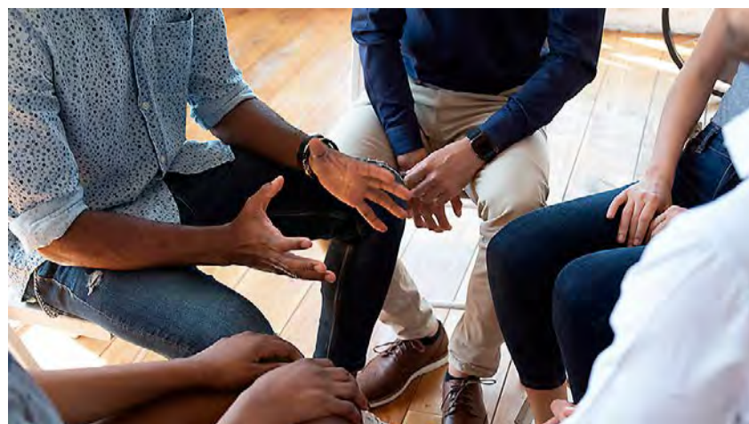
Tampereen NNKY:n Salvia-hankkeen vertaisryhmässä pääsee kuulemaan muiden seksiriippuvaisten läheisten elämästä ja saa vertaistukea.