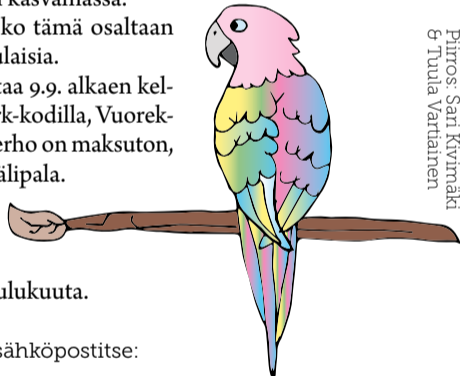
Piirros: Sari Kivimäki & Tuula Vartiainen

Ilmoittautumiset sähköpostitse: sari.kivimaki@evl.fi