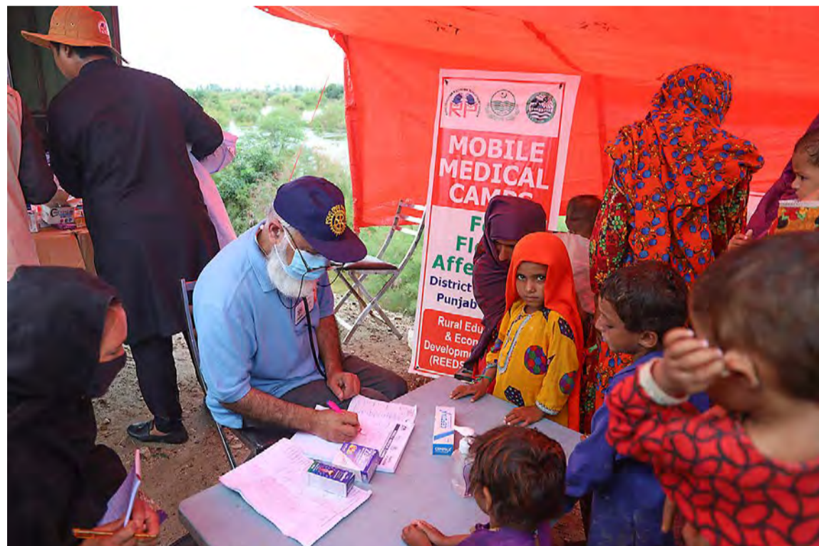
Pakistanin pinta-alasta jopa kolmasosa on tulvaveden vallassa. Yli tuhat ihmistä on kuollut, ja sadat tuhannet ovat väliaikaismajoituksessa.

Pakistanissa monien toimeentulomahdollisuudet ja