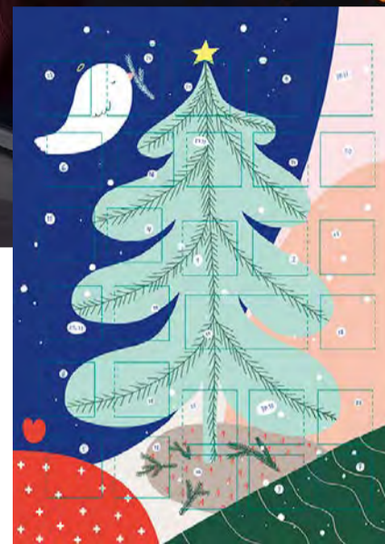
Seurakuntien joulukalenterin on kuvittanut Hanna-Riikka Heikkilä.

– Sen koomin en ole halunnut täältä pois. Täällä on mie-