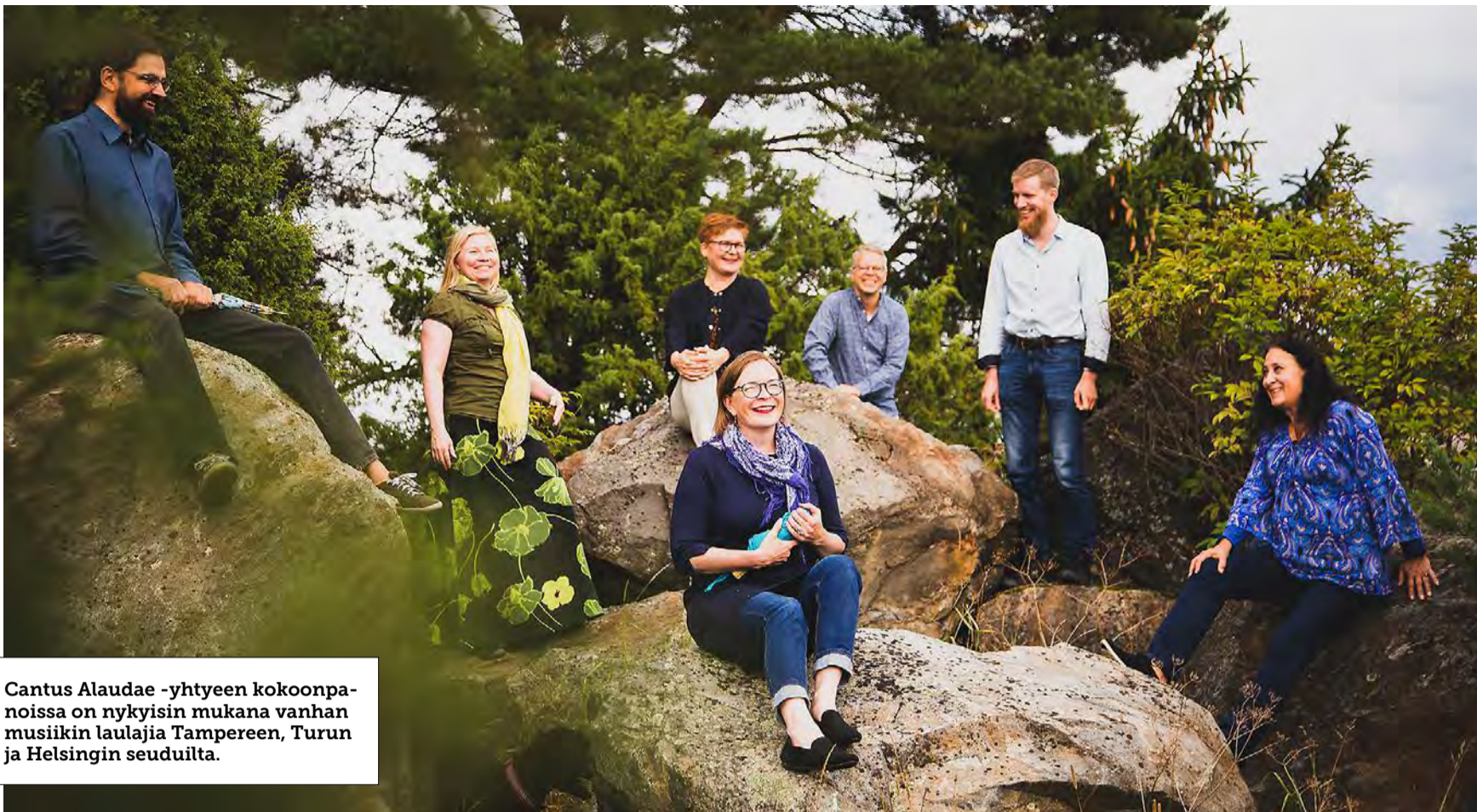
Cantus Alaudae -yhtyeen kokoonpanoissa on nykyisin mukana vanhan musiikin laulajia Tampereen, Turun ja Helsingin seuduilta.