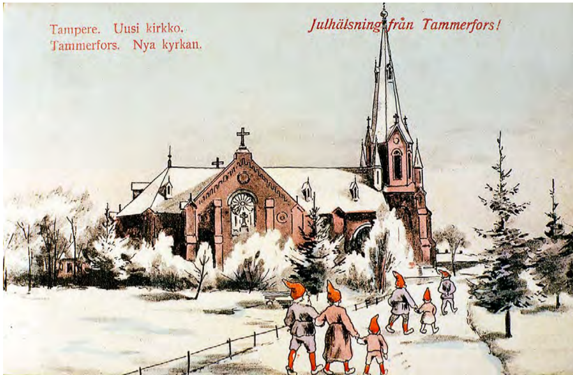
Puu, penkki ja puistotie, joka Tampereen uudelle kirkolle vie.