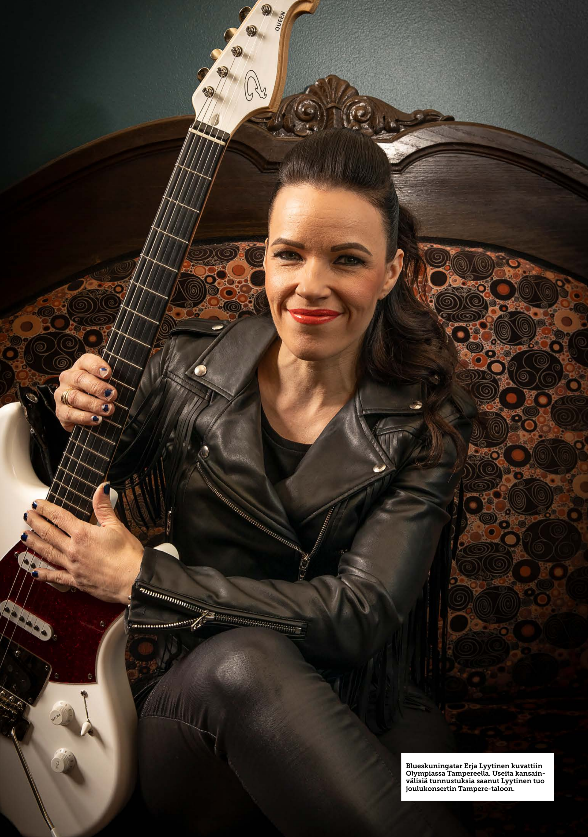
Blueskuningatar Erja Lyytinen kuvattiin Olympiassa Tampereella. Useita kansainvälisiä tunnustuksia saanut Lyytinen tuo joulukonsertin Tampere-taloon.