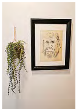
Kuva: Susanna Kiiski

Olotila-näyttelyssäni Seurakuntien talossa on 11.2–5.3. esillä maalauksia, piirustuksia ja grafiikan töitä. Pääteemana on luonto ja sen eläimet. Osa teoksista on myytävänä ja osa maksuttomia. ♦