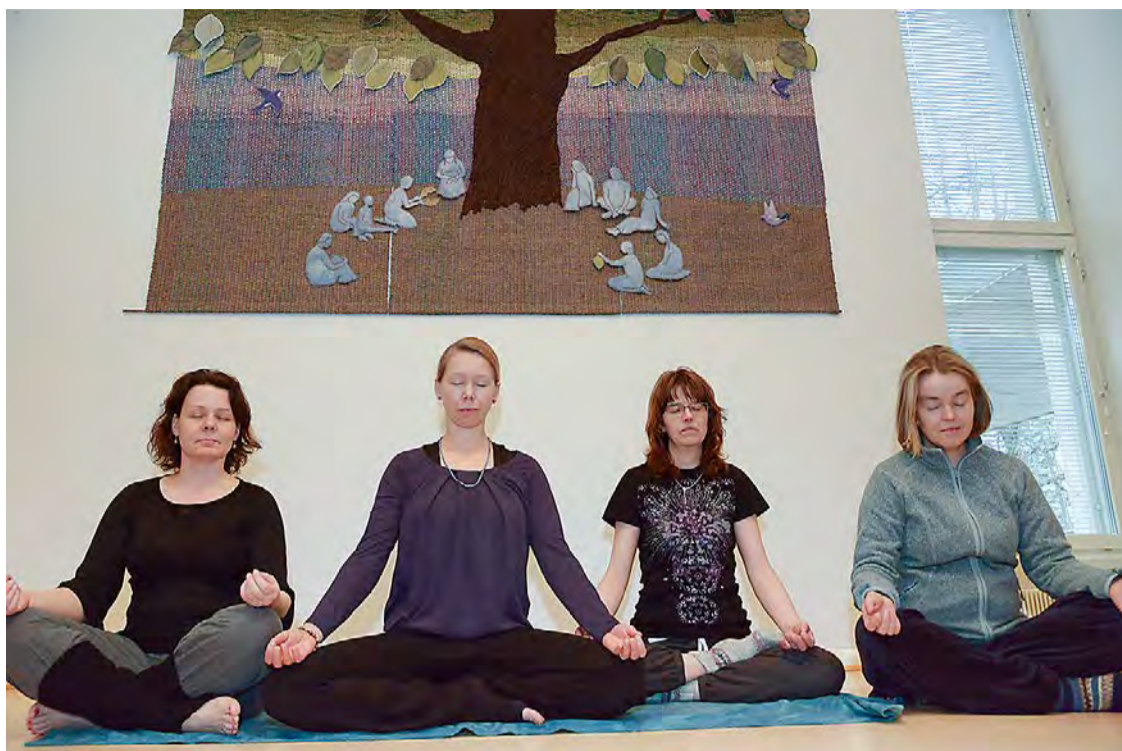
Aleksanterin kirkossa järjestetään kolme ohjattua joogaharjoitusta paaston aikaan.