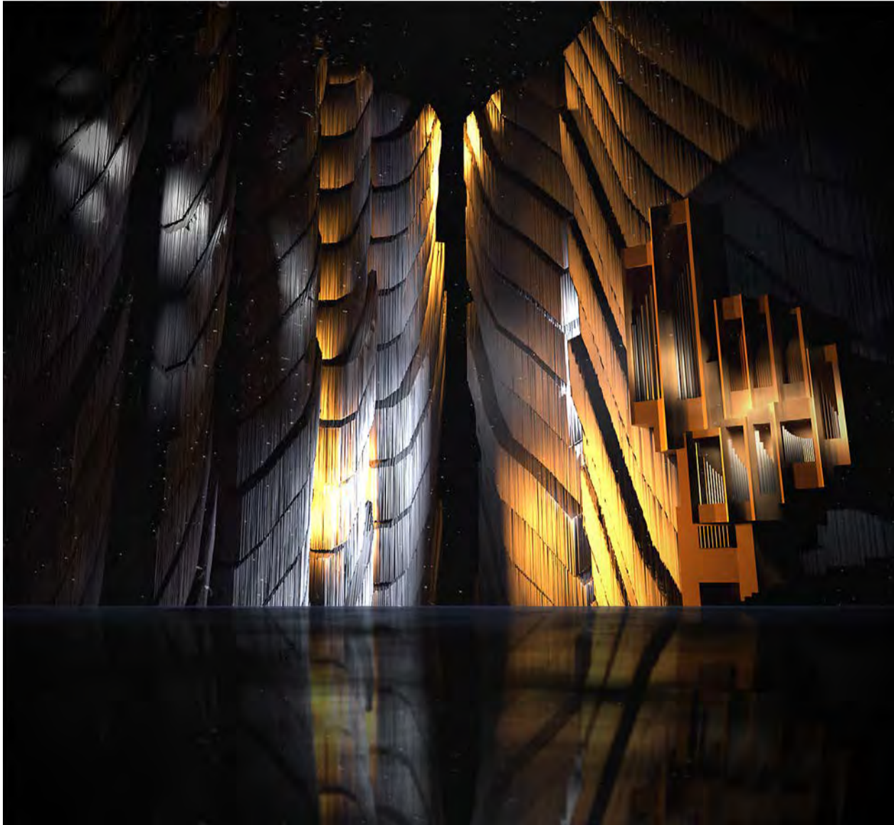
Havainnekuva: Sun Effects

– Toki julkaisemme vain ne ilmoitukset, joiden verkkojulkaisuun olemme saaneet luvan, Jylhäsallo tarkentaa. Kirkolliset ilmoitukset: tampereenseurakunnat.fi/kirkolliset_ilmoitukset