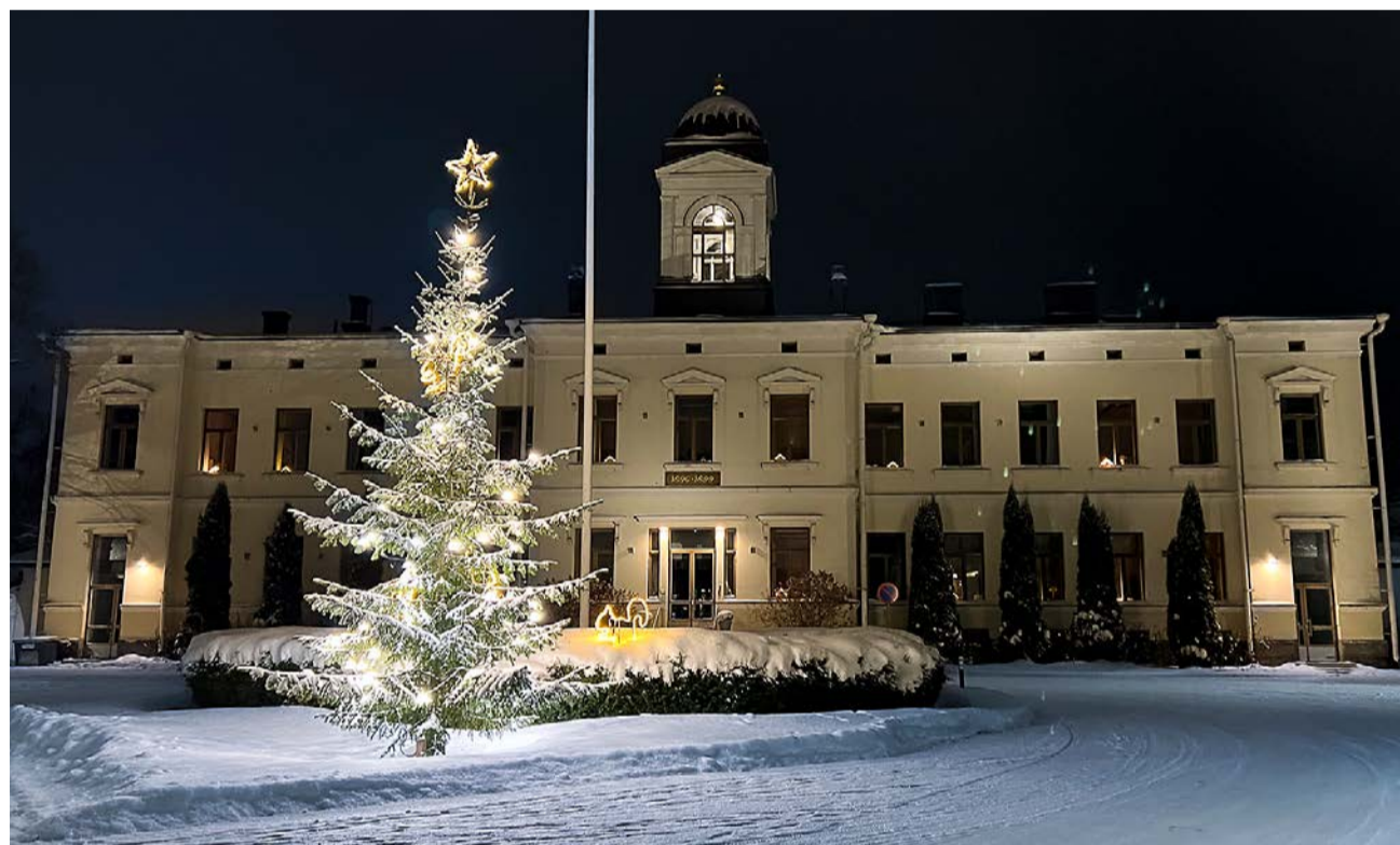
Sairaalakirkko sijaitsee asemakaavalla suojellun Talo 1:n eli Hallintola-rakennuksen 2. kerroksessa.

– Toisaalta sairaalajaksot ovat nykyisin lyhyitä, eikä ympäristöllä ole enää samanlaista merkitystä kuin sillä on ollut joskus aikaisemmin, kun sairaalajaksot olivat monien kuukausienkin pituisia.