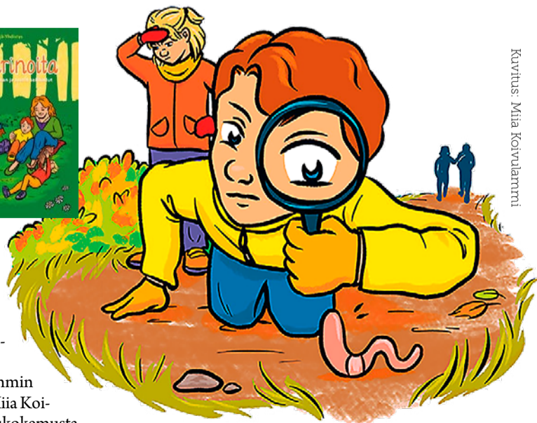
Kuvitus: Miia Koivulammilla

Elina Stüber-Asikainen kokee, että taide auttaa jäsentämään ajatuksia tai rauhoittamaan hektisen arjen keskellä. Tässä omakuvassa näkyy tänään ilo ja Taidetelakan avulla löytynyttä rohkeutta tulla näkyväksi.