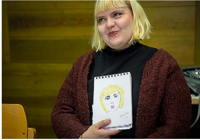
Ida Savolaiselle Taidetelakalla syntynyt iso oivallus on, että taiteen tekeminen on Jumalan kanssa vietettyä aikaa.