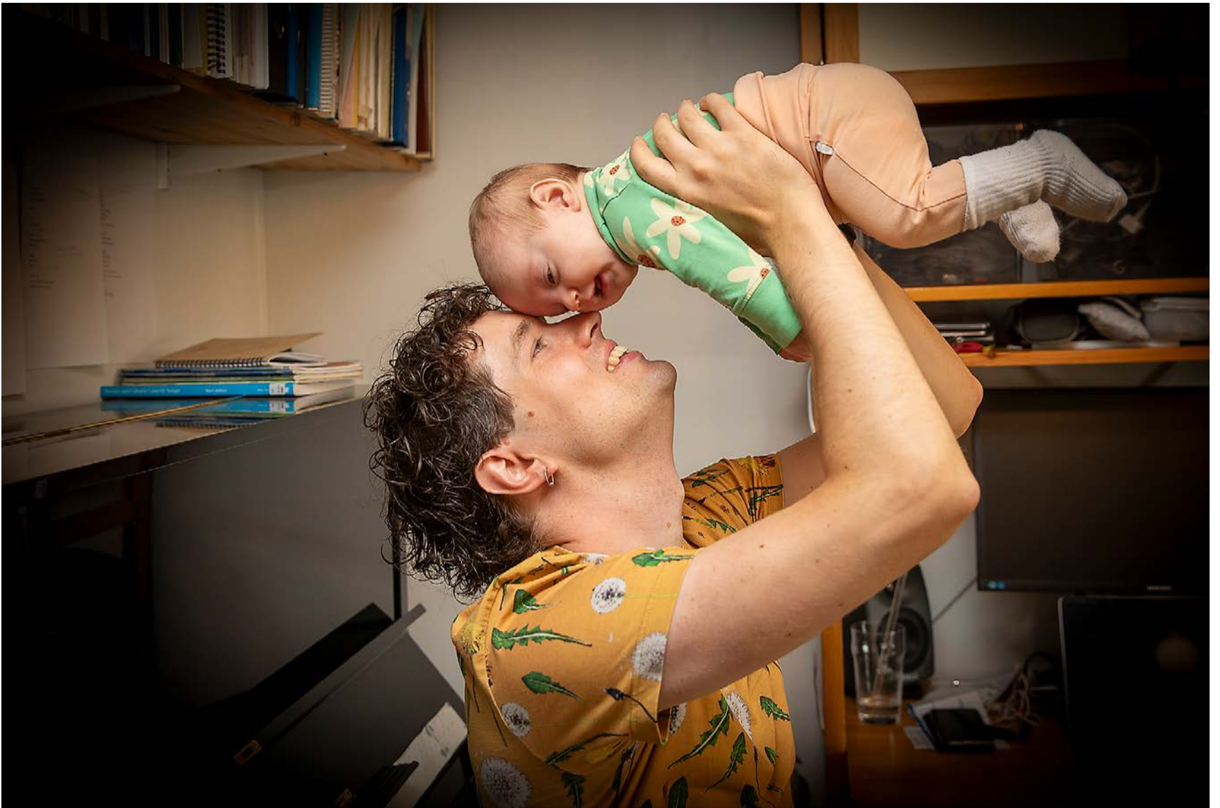
Vauva-arki on ollut antoisaa, mutta myös vaatinut voimia ja keskittymistä perheeseen.

kuorosävellysteokseen, jonka kuoro on tilannut Salmenkankaalta. Merkkivuosi on 2025.