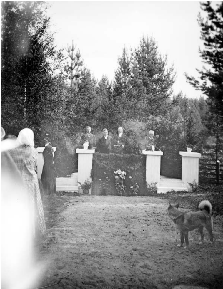
Teiskon hautausmaan lisäosan vihkiäkuvassa vuonna 1924 huomiota yrittää varastaa etualalle asettunut fotogeeninen koira.

Se, miksi kolmesataisjuhlaa vietettiin juuri tuolloin, on mielenkiintoinen kysymys. Ensimmäinen kirkko kun oli otettu käyttöön juhannuksena 1621, oma kappeli-seurakunta perustettu 1636, toinen