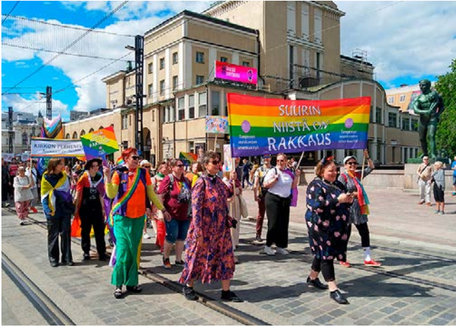
Tampereen seurakuntien sateenkaarityö ja perheneuvonta olivat mukana Tampereen Pride-marsilla kesäkuussa 2024.