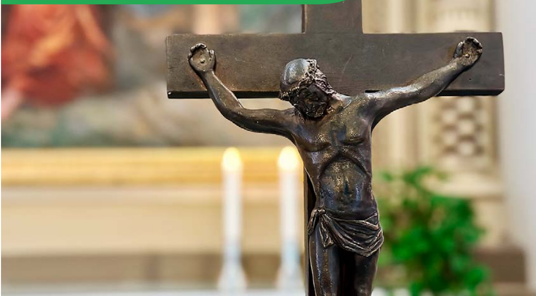
Kuva: Katja Rantavaara