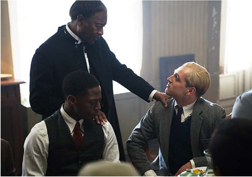
Dietrich Bonhoeffer (Jonas Dassler, oik.) tutustuu New Yorkissa opiskellessaan Harlemin pastoreihin (David Jonsson ja Clarke Peters).